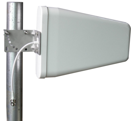
抱杆式安装示意图：